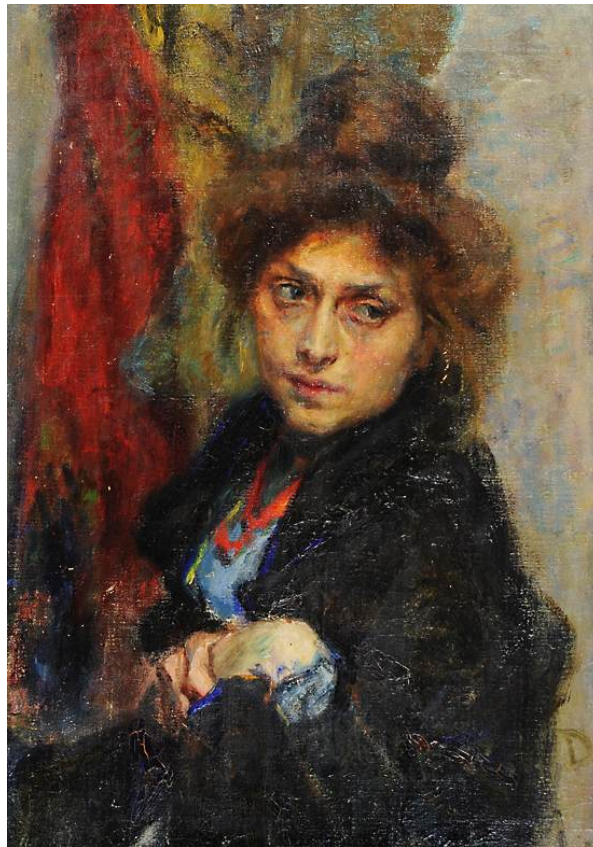
Umberto Veruda, Ritratto di ragazza , 1893

Nella raccolta Bianche e nere , Renzo Streglio e C. Editori, Torino, 1904. Composta probabilmente nel 1900.