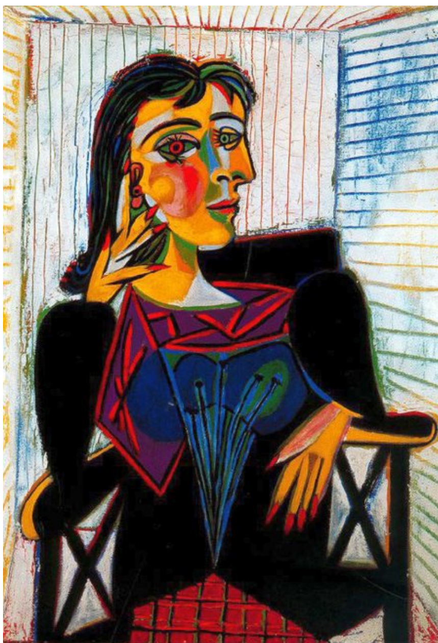
Pablo Picasso, Ritratto di Dora Maar o Dora Maar seduta , olio su tela (92×65

Prima pubblicazione: Prima pubblicazione: Corriere della Sera , 4 febbraio 1912.