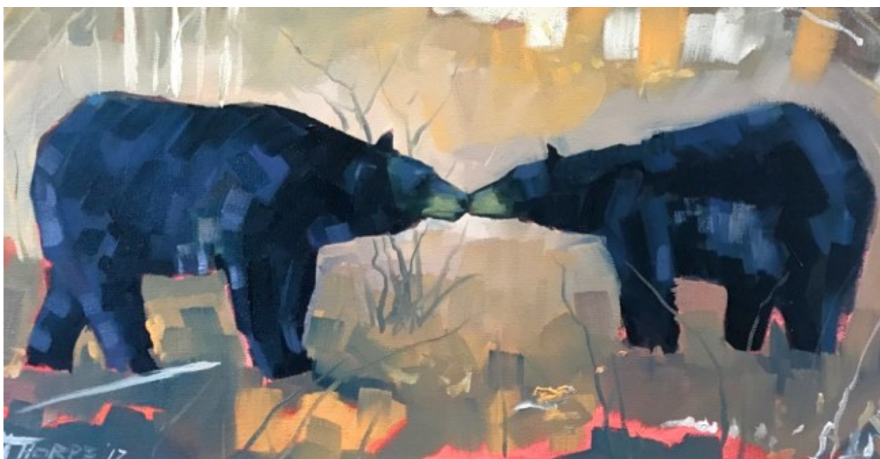
Reid Thorpe, Two bears (Due orsi) , 2017.

Prime pubblicazioni: Corriere della Sera , 22 ottobre 1935, poi in Una giornata , Mondadori, Milano 1937.