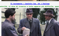
Il testamento - Conclusions

Di Pietro Seditto. Ne erano passati decenni sotto il cielo di Faro, La Chiesa, con tutta la sua autorità, al calano di Trapani e tutto appariva più diretto, quasi impossibile. Ma davvero il Maestro non sarebbe più tornato nella sua terra natale? Il testamento di.