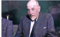
Il testamento - Capitolo 3. Mi s'incalza solo, io un italiano

Di Pietro Seditto. Occorre, di fronte a questa imperiosa richiesta, esaminare il concetto che alimentò l'Autore parlando dell'essere uomo e il suo pensiero che si è smedito attraverso tutti i suoi numerosi scritti. Un rapporto non sempre facile in quanto l'uomo era una parte importante.