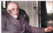
Il testamento - Capitolo 4. E anche fiori mi fanno a meno con amore

Di Pietro Seditto. Nella concezione di Luigi Pirandello esisteva una connessione tra l'uomo e il personaggio e in questo viene a mancare, la stessa esistenza dell'uomo si spoglia completamente per diventare modo ed allora a cosa servono i vestiti, gli orpelli. E quello che è.