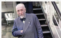
Il testamento - Capitolo 7. E nessuno s'accidenti ad parlarci di amici

Di Pietro Seditto. Nudo era nato in quella campagna agrigentina e nudo voleva ritornare. Nessuno avrebbe, a quel punto potuto contraddire. E in questa sua libera decisione appariva integralmente il concetto di vita che lo aveva alimentato secondo che la Chiesa, in particolare, avrebbe avuto.