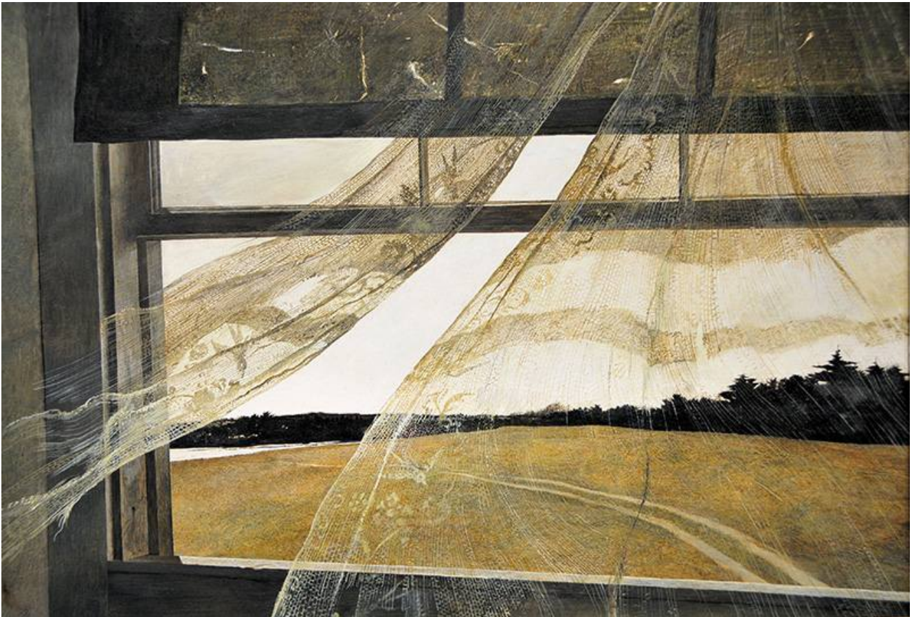
Andrew Wyeth (1917-2009), Vento dal mare , 1947

Prime pubblicazioni: Corriere della Sera , 26 aprile 1914, poi in Il carnevale dei morti , Battistelli, Firenze 1919.